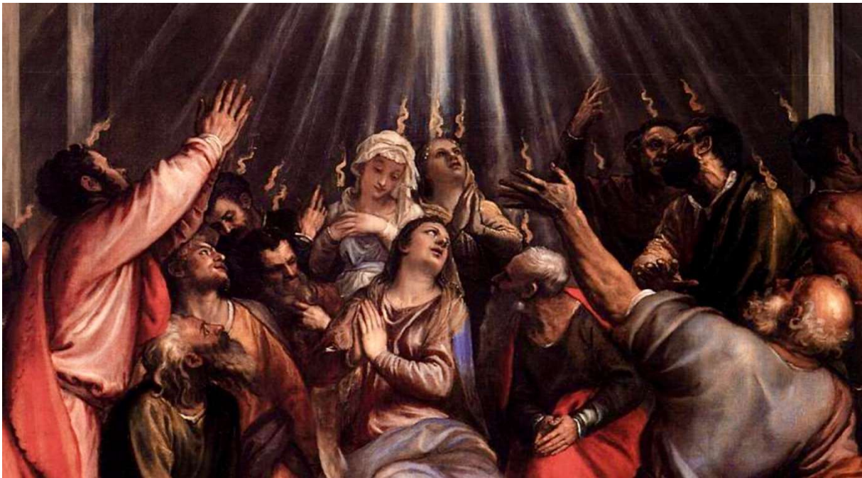
Titian: Aussendung des Hl. Geistes über Männer und Frauen (Ausschnitt)