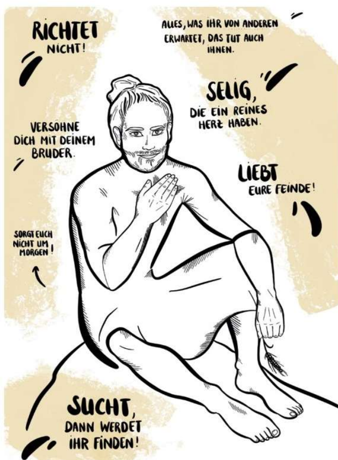
Zeichnung: Irene Maria Unger, Glaube in Sicht

„Alles, was ihr wollt, dass euch die Menschen tun, das tut auch ihnen! Darin besteht das Gesetz und die Propheten.“ (Mt 7,12)