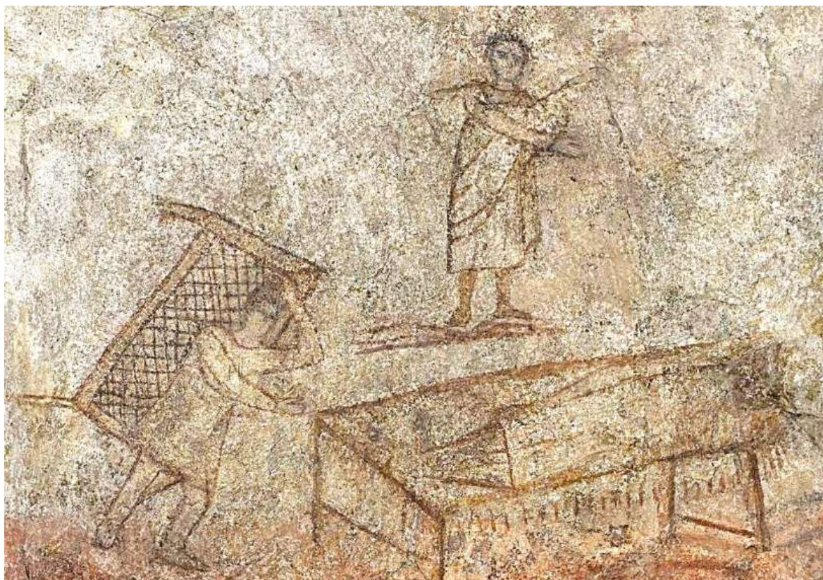
Dieses Fresko (Hauskirche Dura Europos 232/233) mit der Szene Mk 2,1-12 zählt zu den ältesten Darstellungen Jesu, die ihn als bartlosen jungen Mann in römischer Toga zeigen.

Für 2,64 Mrd. Menschen christlichen Glaubens ist Jesus der „Sohn Gottes“ (die menschgewordene Liebe Gottes), für 2,16 Mrd. Muslime und Muslimas ein großer Prophet.