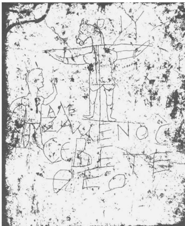
Spottkruzifix, 3. Jh., Palatin: Gekreuzigter mit Eselskopf

„In Jesus hat Gott uns eine Liebe geschenkt, die kraftvoller ist als die Wucht der Sünde und tiefer geht als das Meer des Leides. Keine Sünde ist zu groß, kein Leid zu tief, kein Tod endgültig – Gott bleibt in Jesus an unserer Seite und kann alles zum Guten wenden. Gottes Liebe ist stärker als alles! Liebe ist der Weg der Erlösung.“ (K.V., Glaube in Sicht, S. 74)